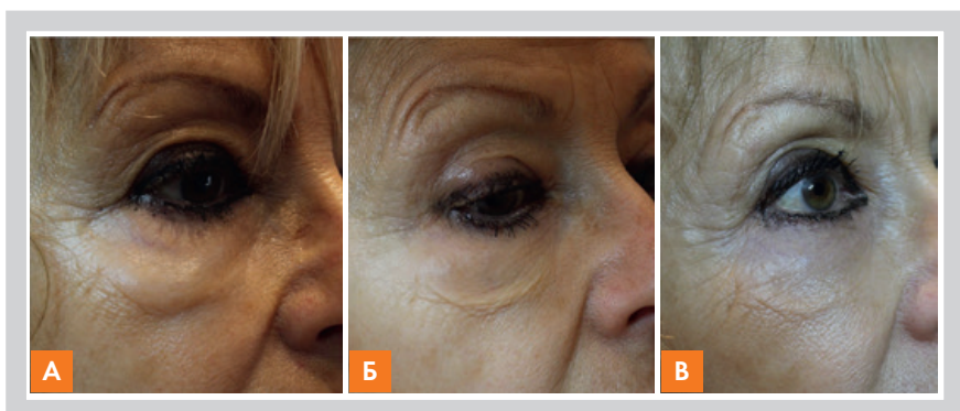
Рис. 1. Показано действие крем-геля Топилаза® с целью устранения мешков под глазами: до нанесения крем-геля (А); через 2 недели после трехкратного нанесения крем-геля (Б); через 4 месяца после нанесения (В)